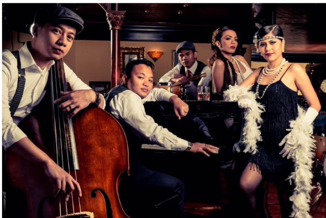
駐場樂隊「5th Dimension」演繹動人心弦的美妙樂韻