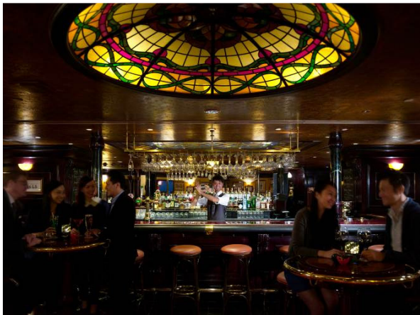
Tiffany's 紐約吧 — 香港的威士忌國度