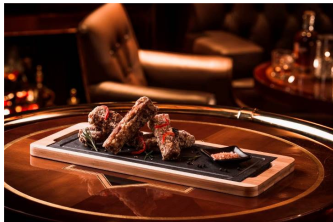
台式胡椒鹽酥排骨