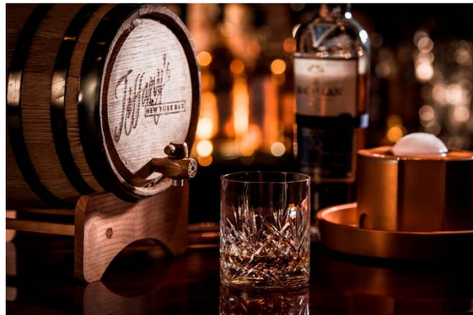
自家木桶釀製的威士忌